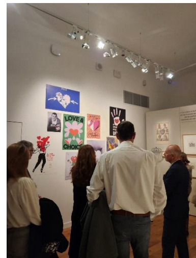
Vernissage de l'exposition temporaire Musée DOBRÉE