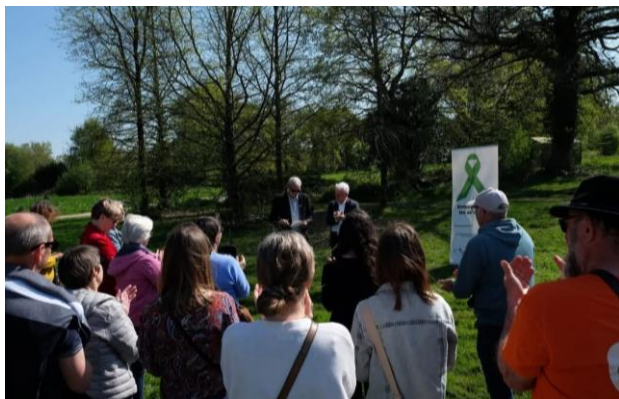
Cérémonie à CHATEAUGIRON