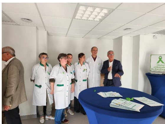
Équipe hospitalière de coordination de prélèvement d'organes et de tissus du CHD La Roche sur Yon