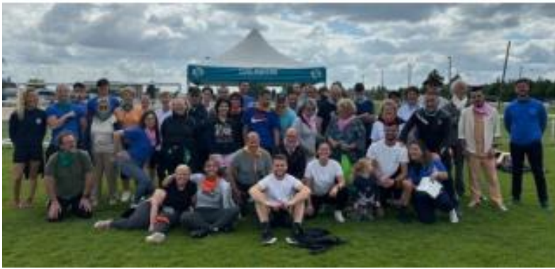
Groupe Cardio Greffe Haute Normandie, le 22 juin