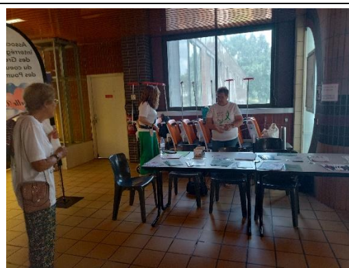
Expositions des témoignages de nos adhérents pour le 22 juin à Laënnec