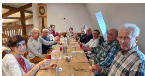
Repas entre greffés du Finistère