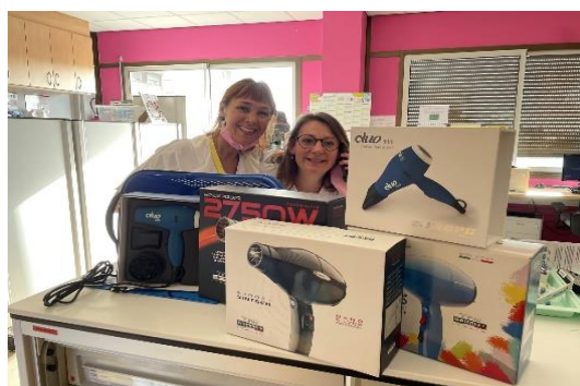
Don de sèche-cheveux à l'UTT et aux soins intensifs